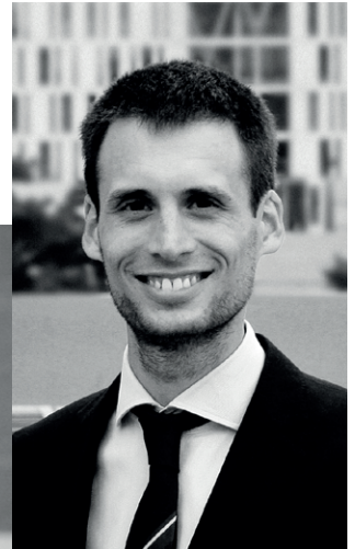
Pierre Alibert @alibert_pierre